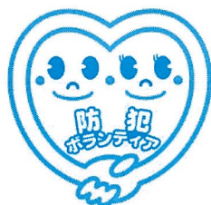
全国防犯協会連合会 防犯ボランティア シンボルマーク

地域住民が互いに手を取りあって、地域防犯、そして心豊かで愛情あふれる安全安心な街づくりに生き活きと取り組む姿をイメージしています。